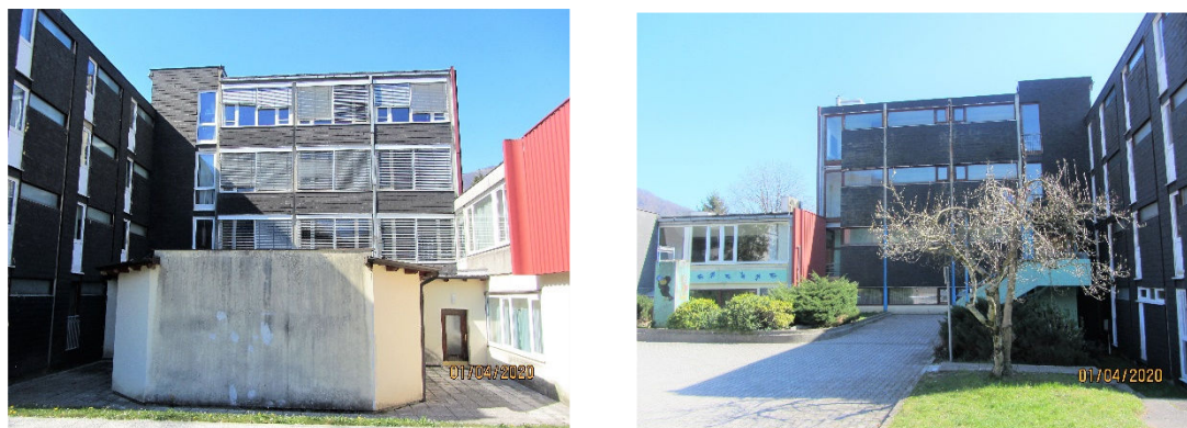
Slika 4: Osrednji povezovalni trakt

Iz hodnika v 1. nadstropju (etaža 300) so na SV delu objekta fasadna vrata na ravno nepohodno streho nad upravnim traktom. Iz shrambe na JZ delu je pod stropom loputa za dostop na streho.