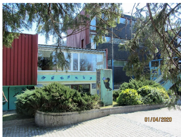
Slika 1 in 2: Obstoječi objekt CŠOD v Tolminu – dom Soča