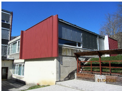
Slika 3: Upravno tehnični trakt