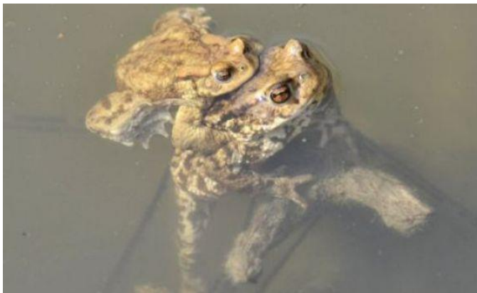
Paritev pri krastačah.

Različne vrste dvoživk imajo različne oblike mresta. Zgornja slika prikazuje oblike mresta nekaterih naših dvoživk.