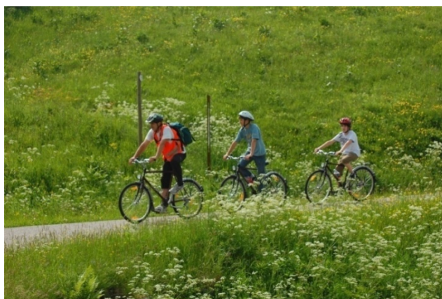
Kolesarjenje po grebenu Kolovrata