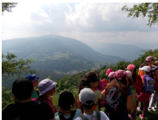
Pogled na Livško