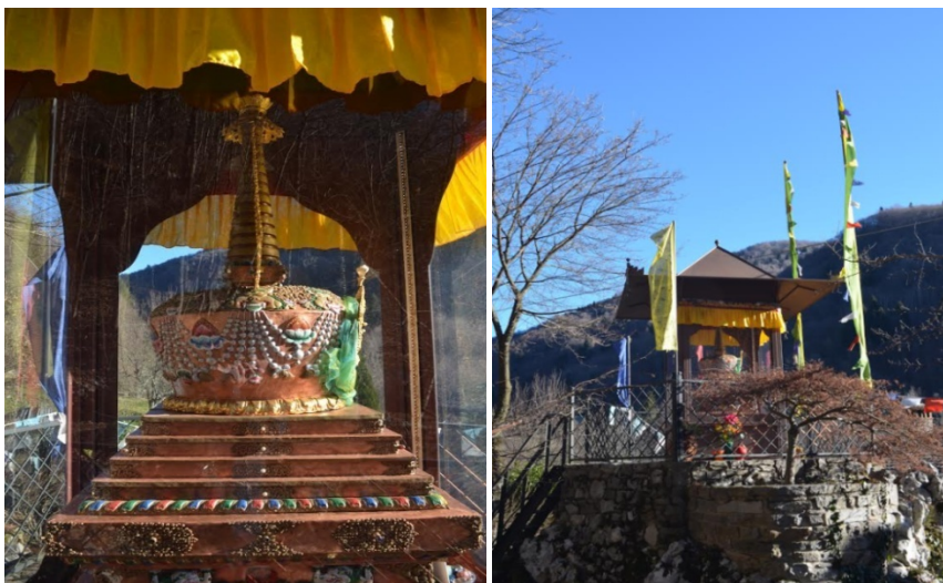
Tibetanski budistični center v Polavi