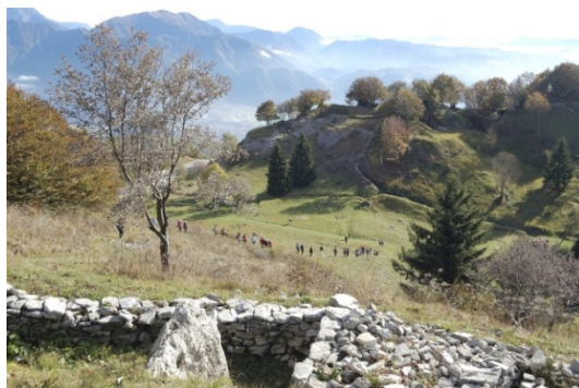
Muzej na prostem »Na gradu«