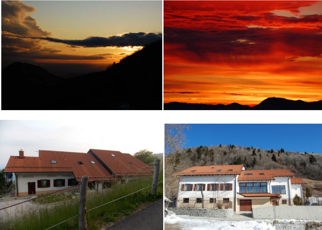
Dom Kavka; vzhod in zahod sonca

Dom Kavka je odprt vse štiri letne čase.